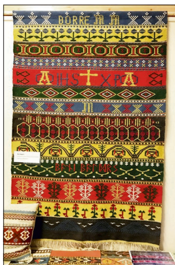
BORRETEPPE: Har elementer av Borrehaugene i seg.